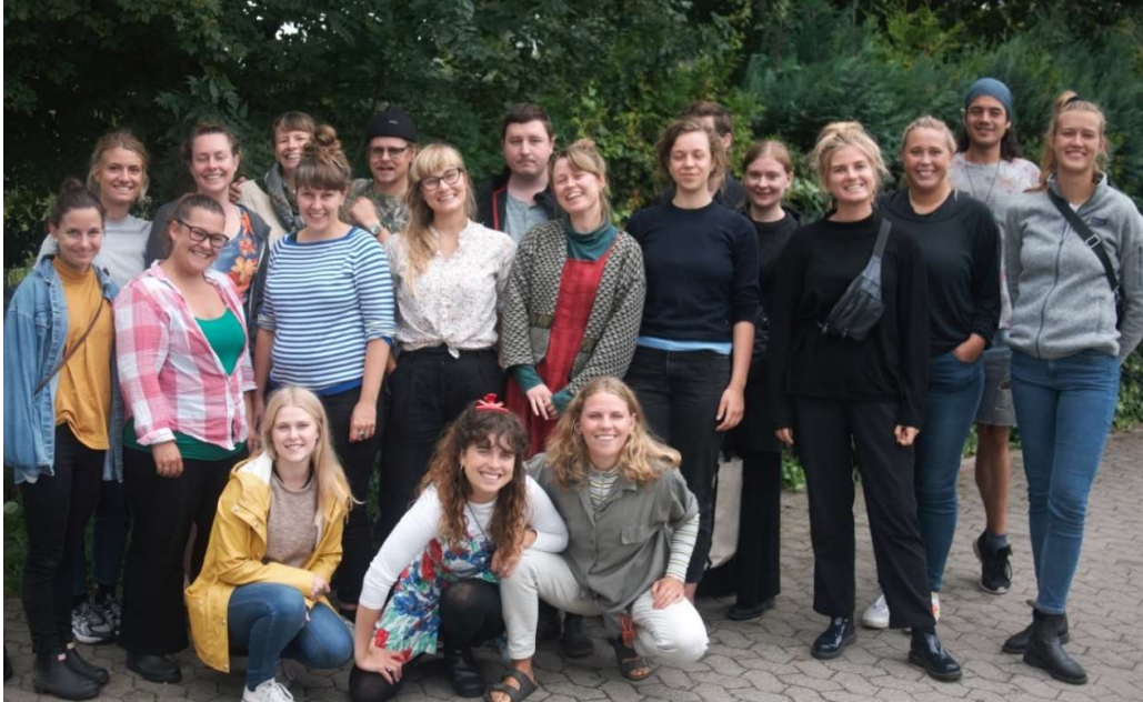
Gruppebillede inden afgang søndag formiddag.

Vi ser frem til Sociologisk Sommerlejr 2020 og håber på at se endnu flere sociologiinteresserede til endnu en lærerig og sjov sommerlejr med nye sociologiske bekendtskaber.